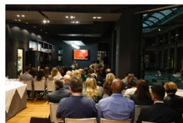
Palette BEYOND ambienti presso lo spazio Victoria + Albert Milano