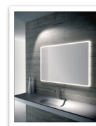
specchio La PROGETTO- fv.jpg

• CLASSIFICA/ La top 350 del Sole: guarda la lista della aziende italiane cresciute di più