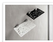
La PROGETTO Serie Dalmata portasapone.jpg