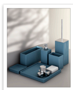
La PROGETTO Serie Accademia copia.jpg