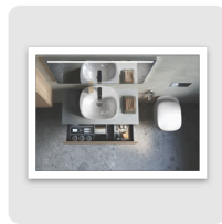
RAK Illusion close up.jpg