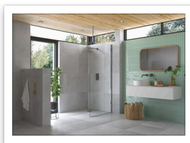
FLAIR_AYO Walk in_ con barra di stabilizzazione a soffitto e vetro 10 mm