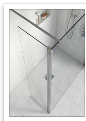
FLAIR_AYO Walk in_ profilo e vetro 10mm