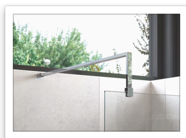
FLAIR_AYO Walk in_ Barra di stabilizzazione L