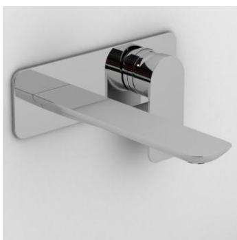
miscelatore lavabo a incasso