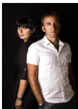
angeletti ruzza design _SENTO