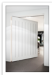
174.2 White pivot door - Francois Hannes.JPG