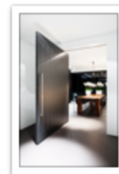
174.4 White pivot door - Francois Hannes.JPG