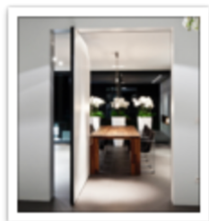
174.1 White pivot door - Francois Hannes.JPG