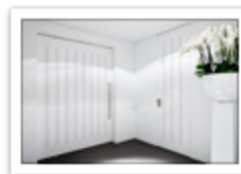
174.3 White pivot door - Francois Hannes.JPG