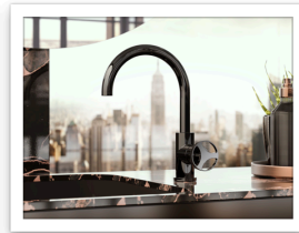
Harley Onyx PVD OX leva tonda