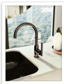
Harley Onyx PVD OX leva lineare