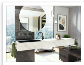
Harley Onyx PVD OX leva lineare ambiente