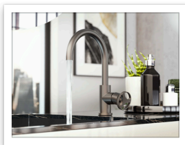
Harley BNi nichel spazzolato leva tonda

Nelle immagini sopra, le finiture selezionate: