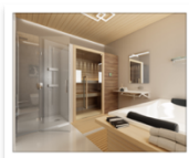
Ponte Giulio turismo