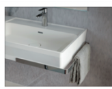
Ponte Giulio casa Life Caring Design 2