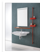
Ponte Giulio Life Caring Design HUG.jpg