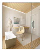
Ponte Giulio turismo 3