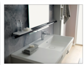
Ponte Giulio casa Life Caring Design