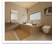
Ponte Giulio 2sportivi