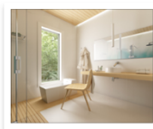
Ponte Giulio turismo _