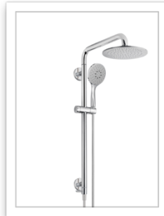
SOLO, sistema doccia sicura .JPG