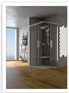
SOLO, ambiente con sistema doccia sicura 2.JPG