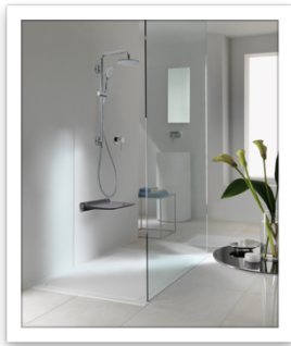
SOLO, ambiente con sistema doccia sicura .JPG