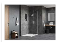
FLAIR AYO CONFIGURATION 13- WHITE.jpg