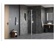
FLAIR AYO CONFIGURATION 11- WHITE.jpg

AYO COLOUR offre tantissime combinazioni, tanto da poterlo definire “uno standard che oltrepassa i normali prodotti attualmente sul mercato” .