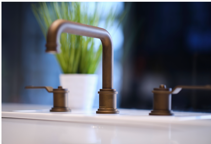
Perrin & Rowe (brand di House of Rohl) Armstrong Miscelatore per lavabo a tre fori in finitura bronzo inglese.

La collezione Armstrong è una delle gamme più complete che Perrin & Rowe abbia mai lanciato, dal miscelatore lavabo monocomando al rubinetto a tre fori, a parete o a ponte. È disponibile anche un iconico miscelatore freestanding vasca-doccia, così come un set doccia completo con doccetta e rosone a soffitto.