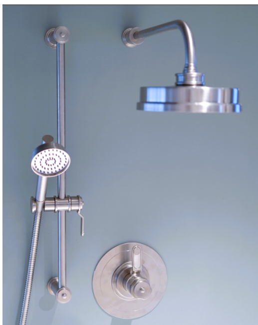
Perrin & Rowe (brand di House of Rohl) Armstrong Set doccia in peltro.

Ogni rubinetto è realizzato con ottone di altissima qualità, versato a mano in stampi a 1700 ° Fahrenheit. Dopo la lavorazione, lucidatori specializzati sviluppano la finitura profonda e brillante. È un compito dispendioso in termini di tempo e scrupoloso. Il miscelatore freestanding vasca-doccia, ad esempio, può richiedere oltre quattro ore per essere perfezionato.