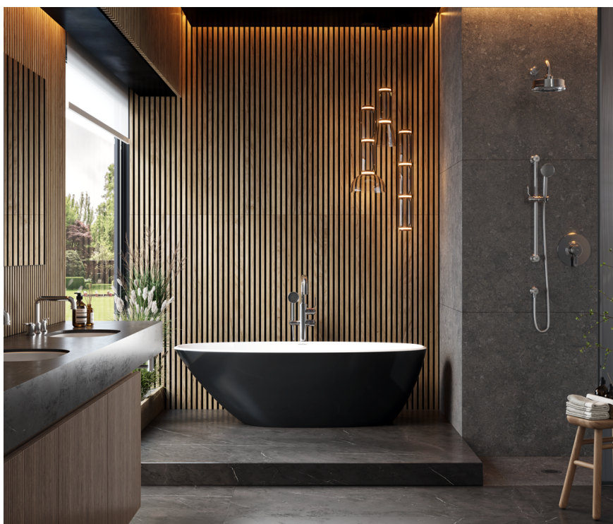
Perrin & Rowe (brand di House of Rohl) Armstrong in finitura Cromo, presentata con la vasca Victoria + Albert Mozzano.