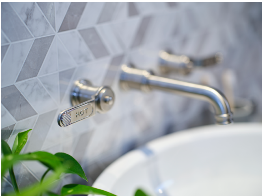
Miscelatore per lavabo a parete Perrin & Rowe (brand di House of Rohl) Armstrong in peltro.