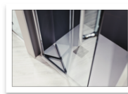
Flair_ETO INFOLD sistema m...innovativo