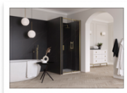
Flair_ETO INFOLD in nicchia_fi...spazzolato