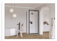
Flair_ETO Infold con pannello l...alternativa