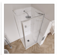
Flair_ETO Infold Cameo.jpg