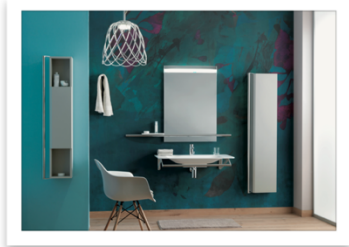
HUG Life Caring design_Ponte Giulio