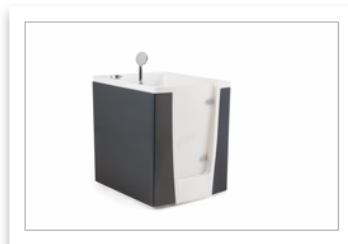
PONTE GIULIO-EVO vasca apribile modello75_grigio.jpg