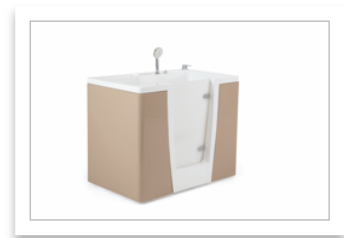
PONTE GIULIO-EVO vasca modell110_nocciola.jpg