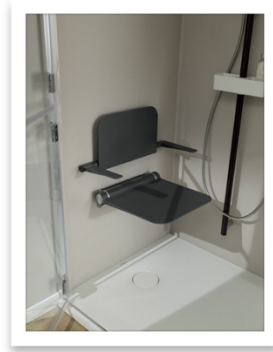
PONTE GIULIO-HUG Life Caring Design_sedile doccia aperto e maniglione