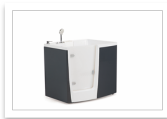
PONTE GIULIO-EVO vasca apribile model..._grigio_SX.jpg