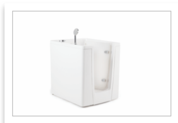
PONTE GIULIO-EVO vasca apribile modello75_bianco.jpg