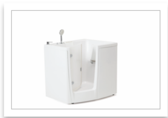
PONTE GIULIO-EVO vasca modell95_bianco_SX.jpg