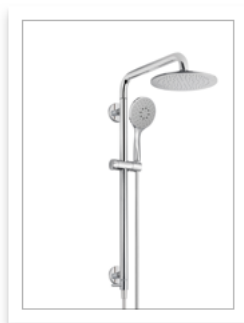
Ponte Giulio SOLO, sistema doc...sicura .JPG