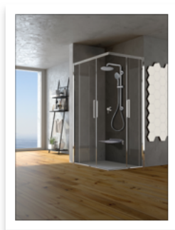
Ponte Giulio Life Caring Design_SOLO

SOLO Shower è apprezzato per rispondere al crescente bisogno di sicurezza, soprattutto in una società che invecchia, offrendo protezione in un'area ad alto rischio come la doccia. Il sistema trasforma la doccia in uno spazio sicuro, la colonna infatti svolge anche la funzione di maniglia di sicurezza, fornendo un supporto solido per agevolare i movimenti e prevenire incidenti.