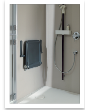
PONTE GIULIO-HUG Life Caring Design_sedile doccia e maniglione

Ponte Giulio garantisce che i suoi prodotti, grazie a rigorosi test di resistenza, durata e biocompatibilità, sono progettati per durare nel tempo. L'applicazione di BioCote® sui prodotti, attiva da oltre dieci anni, offre una protezione antibatterica che inibisce la proliferazione di microbi, batteri, muffe e funghi, assicurando igiene e sicurezza per tutto il ciclo di vita degli stessi.