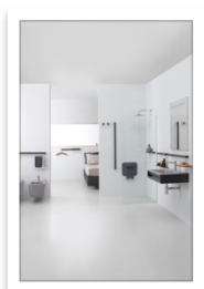
Ponte Giulio_OMNIA ambiente