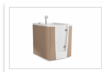
PONTE GIULIO-EVO vasca apribile model...5_nocciola.jpg