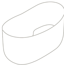
KOIBO135 135X78 H 85

Realizzata in LivingTec® , materiale molto resistente, misura appena 135 cm ed è disponibile bianca opaca o in tre colori opachi della gamma BAGNO DI COLORE (Castagno, Agata e Perla). Un connubio tra purezza delle forme, prestazioni elevate e un'estetica contemporanea che si integra perfettamente e armoniosamente con l'intero catalogo Globo, restando fedele alla tradizione del Made in Italy.