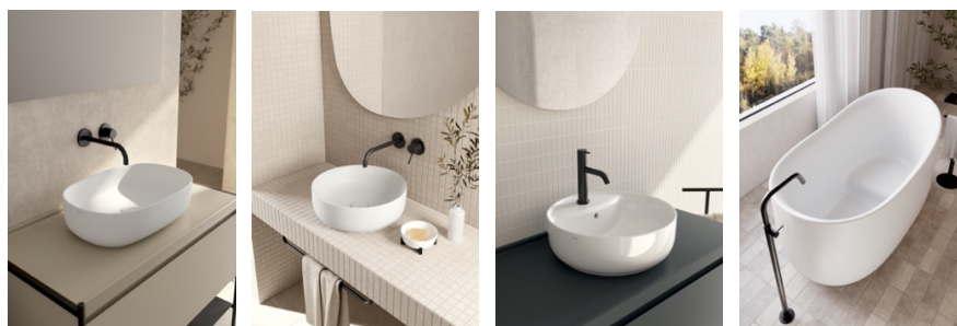
Lavabi KOI design Federica Biasi

Lunedì 17 e martedì 18 marzo ore 10:00-17:00