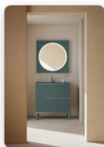
GLOBO Gisele_mobile_Riflessi di luce Denim.peg