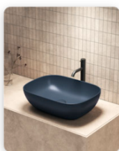
GLOBO_Bagno di Colore_BLU REALE.jpeg