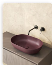
GLOBO_Bagno di Colore_AZALEA.jpeg