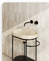
GLOBO_Riflessi di Luce Sand_.jpeg