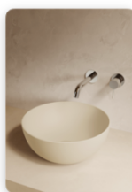
GLOBO_Bagno di Colore_CREMA.jpg