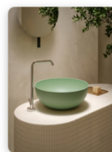
GLOBO_Bagno di Colore_VERONESE.jpg