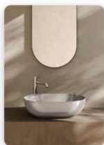
GLOBO_Riflessi di Luce_Lavanda .jpg