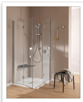
Ponte Giulio Life caring design Colonna sicura SOLO saliscendi 2.JPG