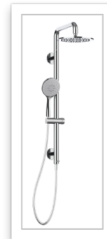
Ponte Giulio Life caring design Collezione SOLO colonna doccia sicura saliscendi .JPG