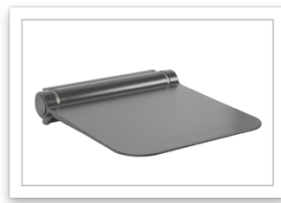
Ponte Giulio Life caring design Collezione HUG sedile ribaltabile grigio. JPG.JPG

LIFE CARING DESIGN vuol dire anche SOLO , il sistema doccia intelligente nella nuova versione saliscendi progettato e fabbricato in Italia. Realizzato in acciaio inox, garantisce una resistenza alla trazione superiore a 200 kg. Resistente alla corrosione, non contiene piombo né rilascia nickel. La ricettività batterica è ridotta al minimo e la rimozione delle impurità è facilissima.