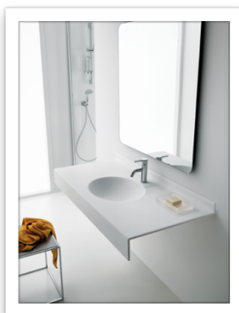
Ponte Giulio Exclusive Design Collezione Midioplan.jpg

Il programma di piatti doccia, lavabo e consolle MIDIOPLAN è stato elaborato per poter consentire la massima libertà nelle forme, nelle dimensioni e nei colori, offrendo la possibilità di personalizzare i prodotti base o addirittura di crearne su disegno specifico.