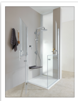
Ponte Giulio Life caring design Colonna sicura SOLO saliscendi

Mai più sbalzi di temperatura grazie all'innovativo "cuore sensibile" che mantiene sempre la temperatura desiderata: si evita sia lo spreco di acqua, che spiacevoli scottature.