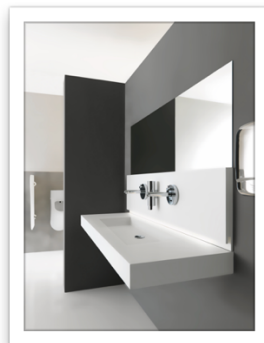
Ponte Giulio Exclusive Design Collezione Midioplan contract