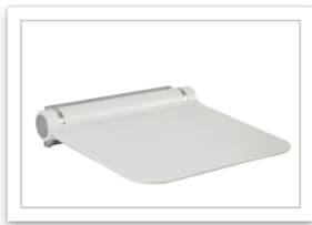
Ponte Giulio Life caring design Collezione HUG sedile ribaltabile bianco.JPG

Fanno parte della collezione HUG anche la maniglia, gli accessori removibili, i mobili, gli specchi, i lavabi, i box e i piatti doccia.