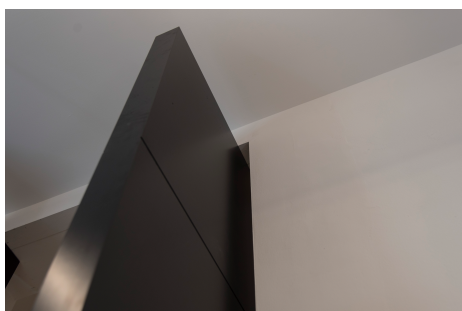
Porta Linvisibile System 4 FritsJurgens® Fuorisalone 2017 Archiproducts Milano. Visibile fino al Salone del Mobile 2018

FRITSJURGENS ITALIA SRL Via Marsilio Ficino 22 50132 Firenze T. +39 055 0640290 / +39 366 1948848 info@fritsjurgens.com http://www.fritsjurgens.com